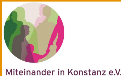
Miteinander in Konstanz e.V.